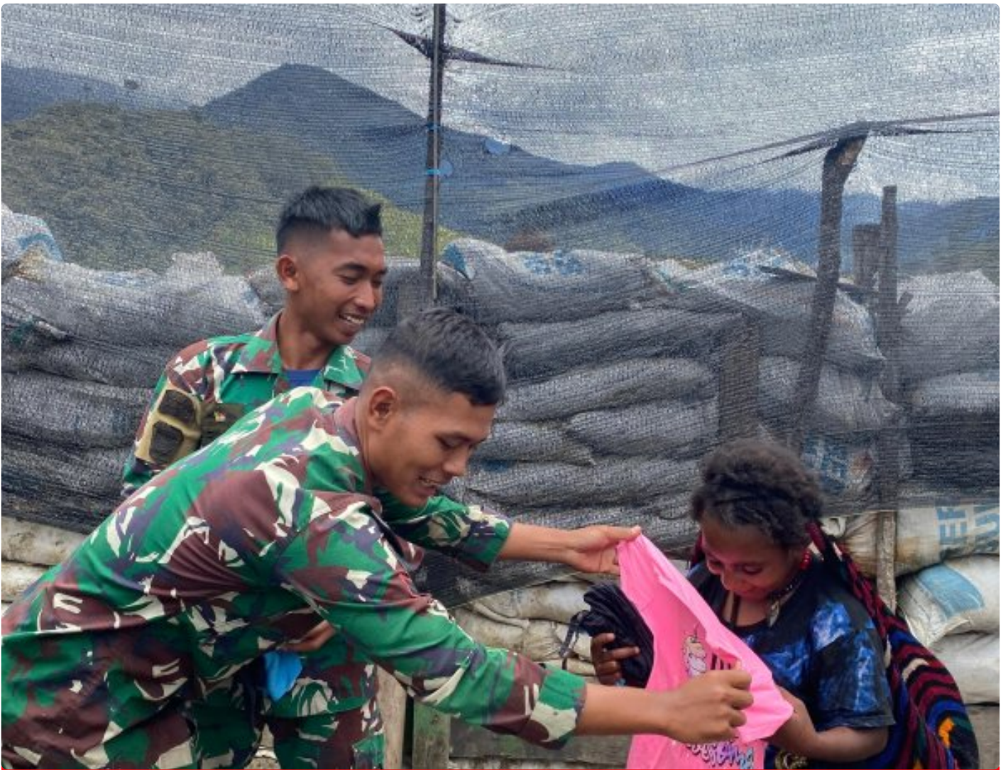
Satgas Yonif 323 Buaya Putih Bagikan Pakaian kepada masyarakat sekitar Titik Kuat

Satgas Yonif 323 Buaya Putih Kostrad kembali menunjukkan kepeduliannya kepada masyarakat sekitar dengan membagikan pakaian layak pakai di sekitar titik kuat operasi, Aksi ini merupakan bagian dari program kemanusiaan yang dilakukan oleh Satgas dalam rangka mempererat hubungan antara TNI dan