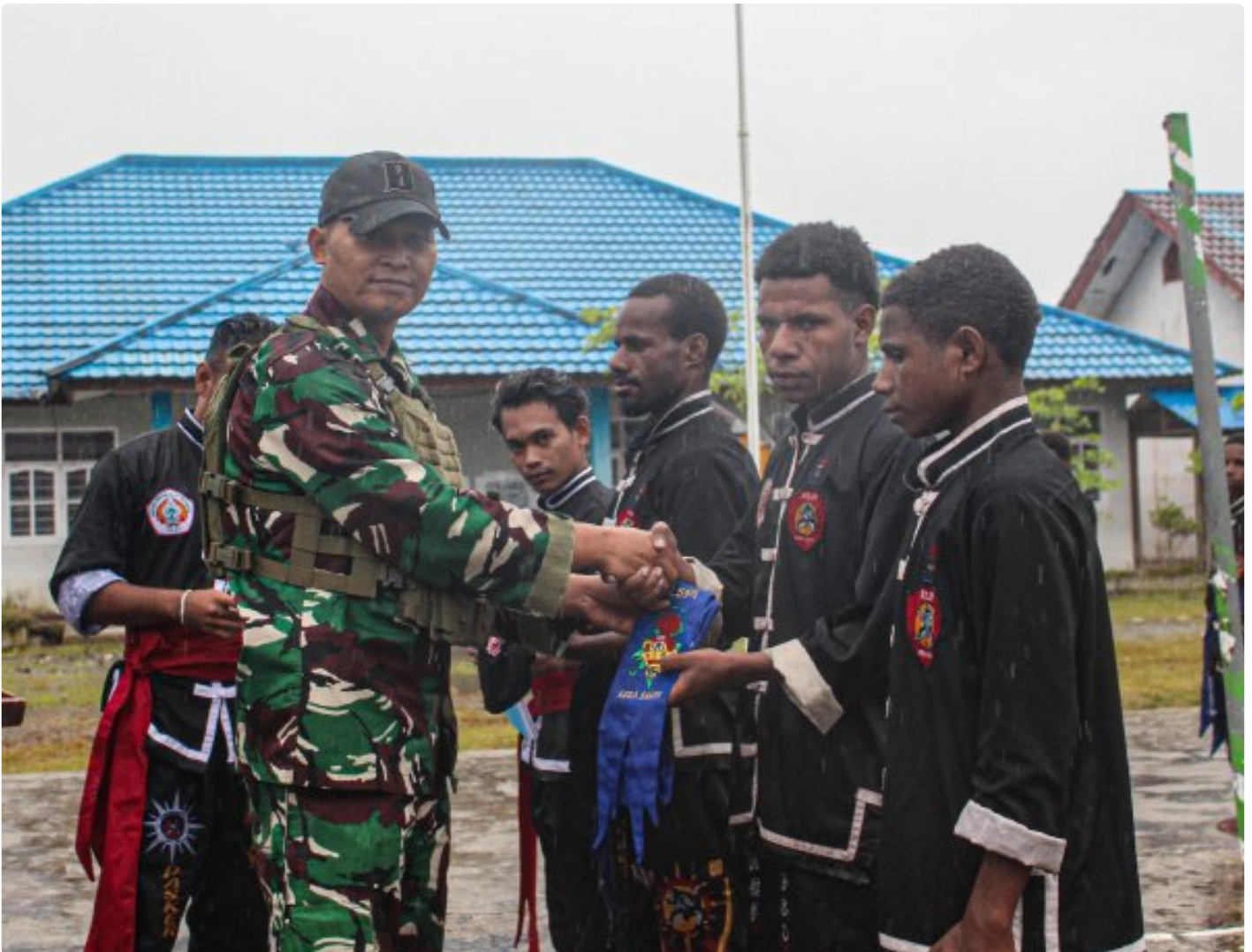
Satgas Pamtas Mobile RI-PNG Yonif 503/Mayangkara melaksanakan kegiatan komunikasi sosial bersama IKS Kera Sakti Pasker Nduga di Distrik Kenyam, Kabupaten Nduga, Papua, Selasa (17/12/2024).

NDUGA- Dalam upaya mempererat persaudaraan dan membangun kedekatan