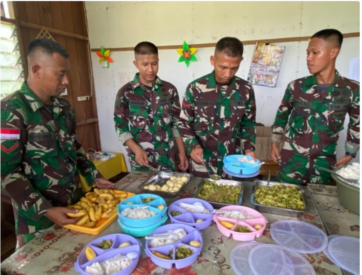
Foto: Dedikasi Satgas Pamtas Mobile RI-PNG Yonif 503/Mayangkara dalam mendukung program makan bergizi gratis pemerintah mendapat apresiasi tinggi dari masyarakat Distrik Krepkuri, Kabupaten Nduga, Papua, di sekolah rimba, Rabu (29/01/2025).